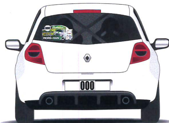
ARRIÈRE PLAQUE DE COURSE + NUMÉRO