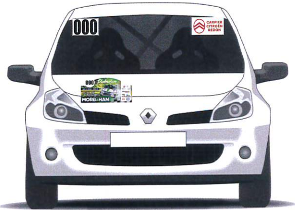
AVANT PLAQUE DE COURSE + NUMÉRO + CITROËN