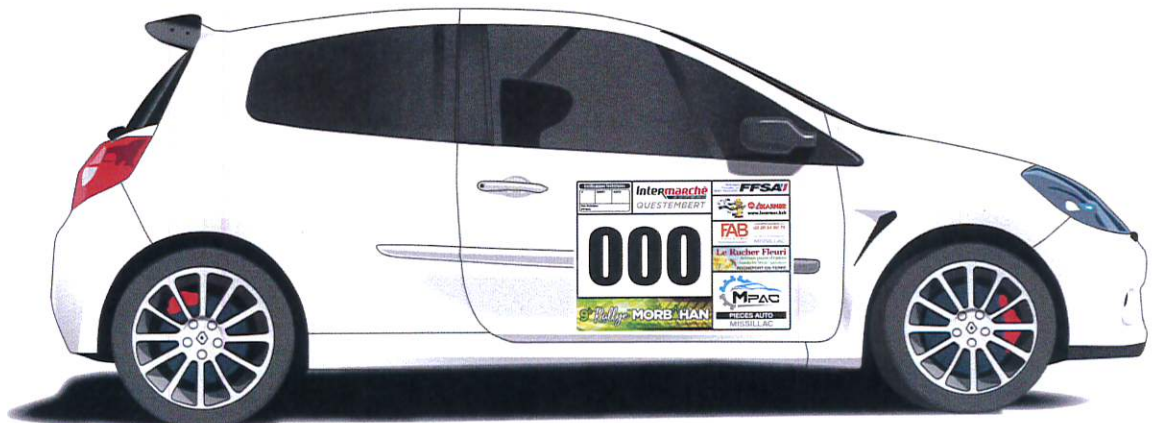
CÔTÉ COPILOTE : PANNEAU DE PORTE